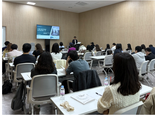
2025 이슈컨퍼런스 사진