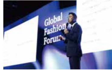
▲ 글로벌 패션 포럼