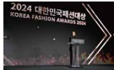
▲ 대한민국 패션대상