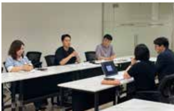
▲ 지식재산권 보호 서비스