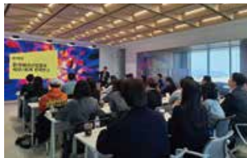
▲ 이슈 컨퍼런스