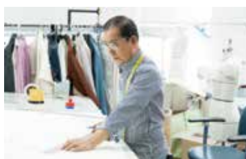
▲ 의류 패턴 개발 지원