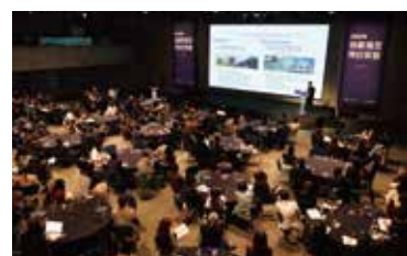
▲ 의류제조 혁신포럼